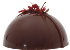
Prix d'excellence: Demi-lune à la raisinée bio